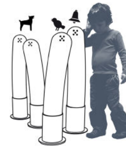
Les tubes à sons