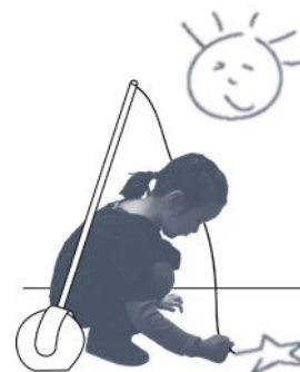
Les stylos lumineux