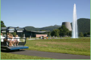
Reconstitution d'un geyser