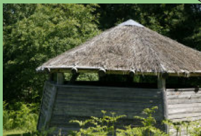
Construites par la LPO (Ligue de Protection des Oiseaux), elles sont à l'origine des lieux d'observation et de surveillance des oiseaux migrateurs.