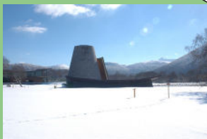
Vue panoramique sur la Chaîne des Puys.